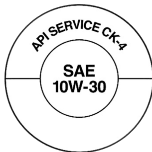
“Dona de servicio”